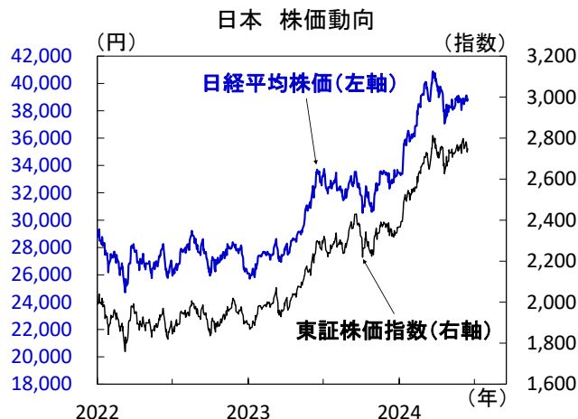
【図2】会合後、株価は上昇