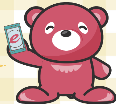
当社オリジナルキャラクター eクマ